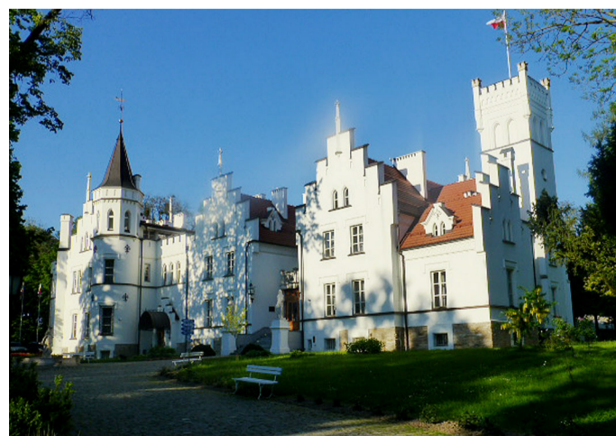
Schloss Sulislaw ist heute ein Fünf-Sterne-Hotel.