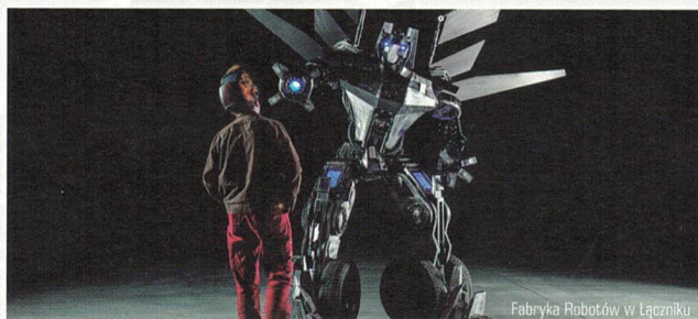
Fabryka Robotów w Łęczniku