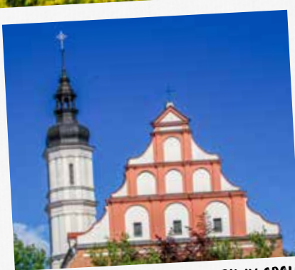
DE GOTISCHE FRANCISCANENKERK IN OPOLE, EEN PLEK VOOR BEZINNING & GEBED

Opolskie, de kleinste provincie van Polen in de historische landstreek Silezië, doet misschien niet meteen een belletje rinkelen. Meer weerklank hebben Wrocław en Krakau waartussen je 'het land van Opole' moet situeren. Hou je van rust en ongerepte natuur, eenvoudig landleven, ver weg van de waan van de dag, dan zou dit terra incognita je wel eens aardig kunnen verrassen. Voorwaar, een ongekunsteld patchwork waar 'slow travel' en 'slow life' perfect harmoniëren.