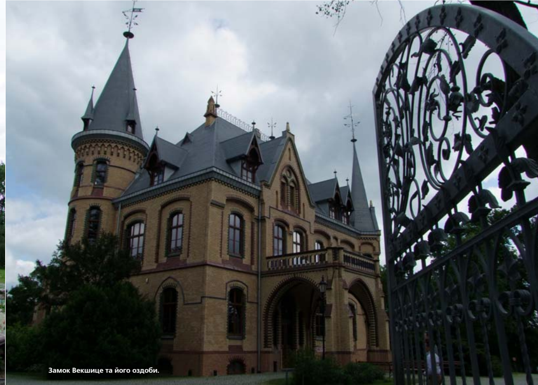
Замок Векшице та його оздобу.