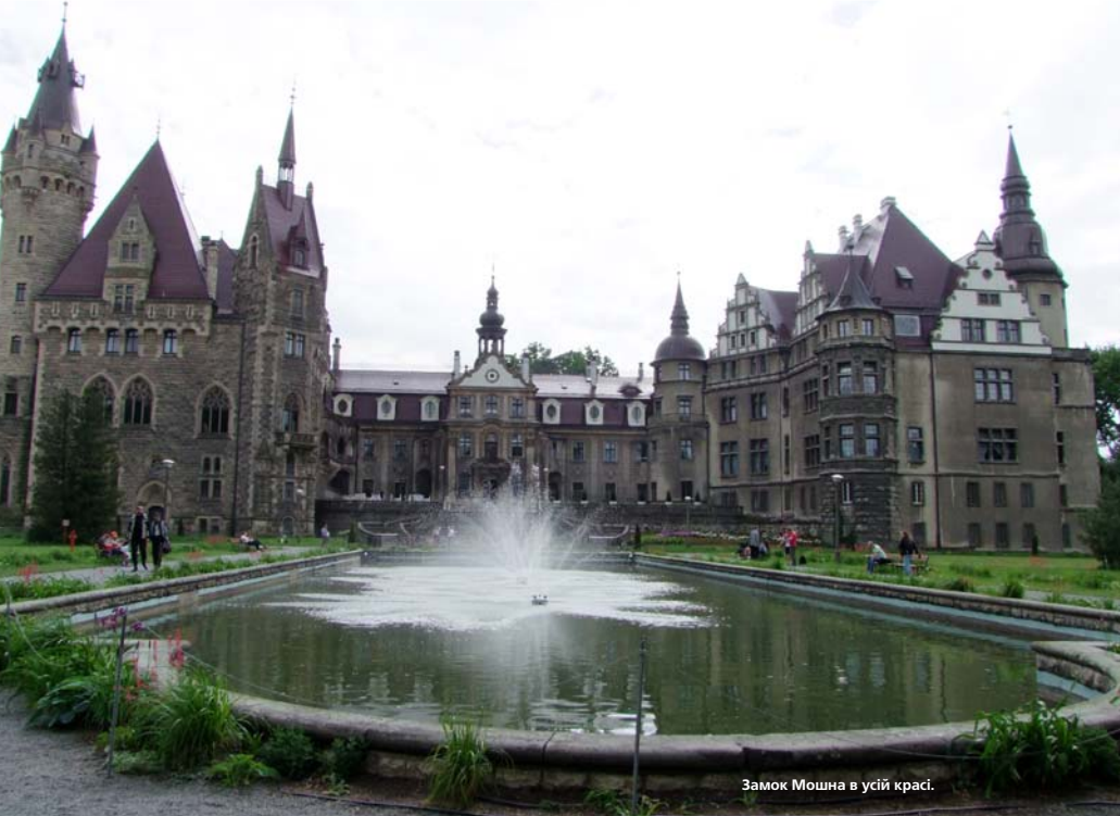
Замок Мошна в усій красі.