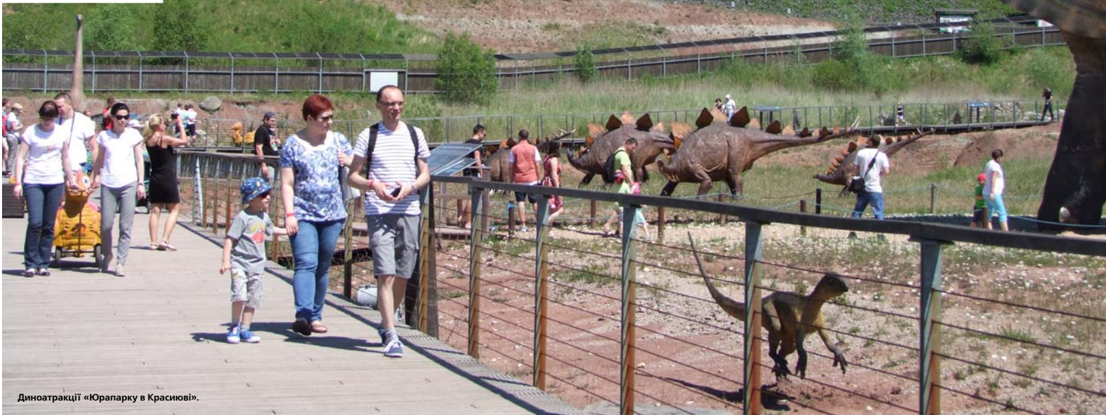
Динотракції «Юрапарку в Красивові».

Що можна очікувати від парку з пластиковими фігурами ящерів? Сміх та й годі. Але ж Опольщина вирішила дивувати і до кінця дотрималася своєї обіцянки.