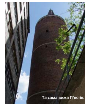
Та сама вежа П'ястів.

Р аніше мене доля до Ополь та його земель. Це не перша моя подорож до Польщі, тож певні очікування були. Але це найменше востаннє їх перевершило.