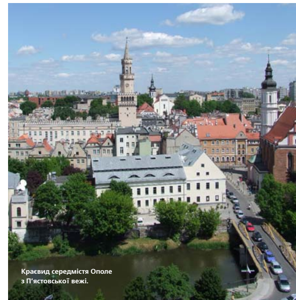
Краєвид середмістя Ополь з П'ястовської вежі.